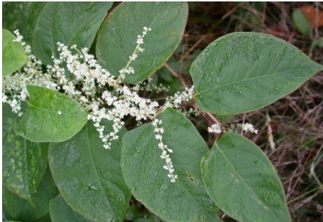
Parkslirekne i blomst.

For noen uker siden sendte kommunen brev til alle grunneiere som har eiendommer der vi kjenner til at det er kjempebjørnekjeks. I brevet beskriver vi hvilke tiltak du kan gjennomføre for å bekjempe planten. Det er helt sikkert flere forekomster av kjempebjørnekjeks i kommunen vi ikke har oversikt over.